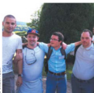
De jeunes trisomiques lors d'une sortie.